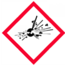
Aluminiumskylt Sprängämnesförråd Romb