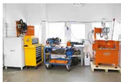
Serviceverkstad med demomaskiner