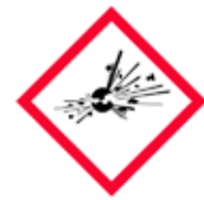
Magnetskylt Fordon Romb