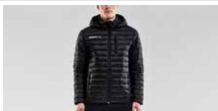
BEF Jacka Craft – Herr

Craft Isolate Jacket med BEF logotyp på höger arm. Storlek: M, L och XL