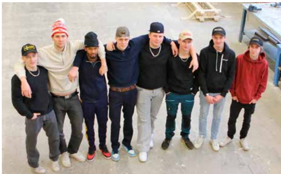
Elever i åk 3 på inriktning Bergteknik samt inriktning Mark och anläggning på Spångbergsgymnasiet i Filipstad.

Bergteknikutbildningen på Spångbergsgymnasiet är unik då den är den enda i sitt slag i Sverige. Gruv- och bergtekniktraditionerna i området har skapat naturliga förutsättningar för att