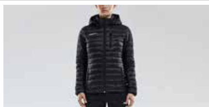
BEF Jacka Craft – Dam

Craft Isolate Jacket med BEF logotyp på höger arm. Storlek: M, L och XL