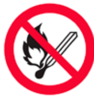
Aluminiumskylt Sprängämnesförråd Rund