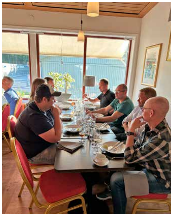
Här sitter eleverna som går kursen på Spångbergsgymnasiet och äter.