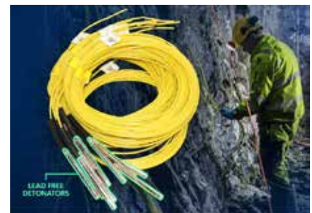
Exel™ Neo, världens första blyfria icke-elektriska sprängkapsel