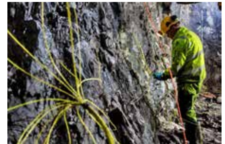
Exel™ LP används vid tunneldrivning

1) Orica använder inte bly eller blyföreningar i sina tillverknings- eller produktionsprocesser i Sverige och vidtar åtgärder för att söka garantier från sina leverantörer.