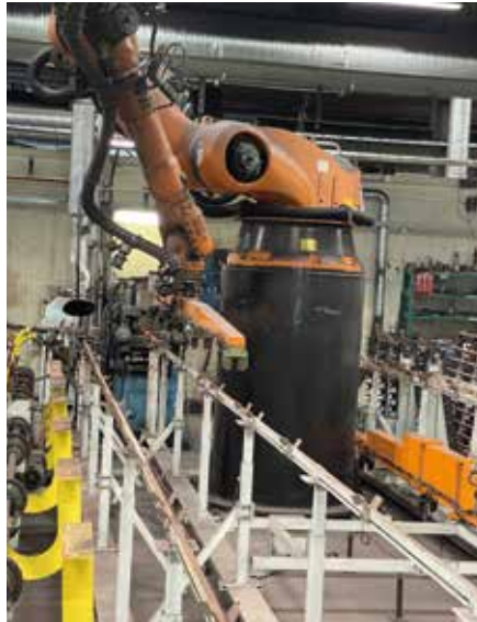
Moderna robotar automatiserar produktionen.