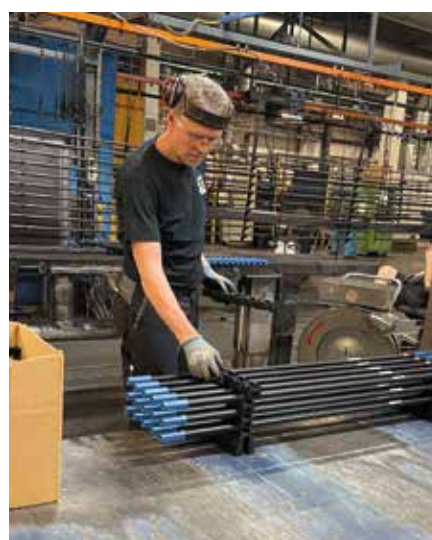
Förbereder för leverans till kund.