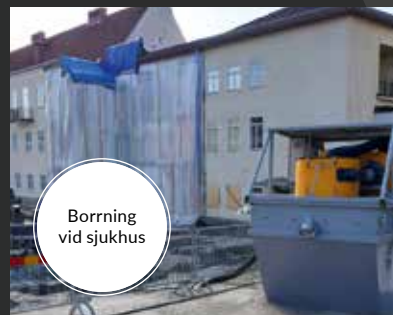
Borring vid sjukhus