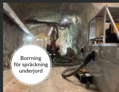
Borring för spräckning underjord