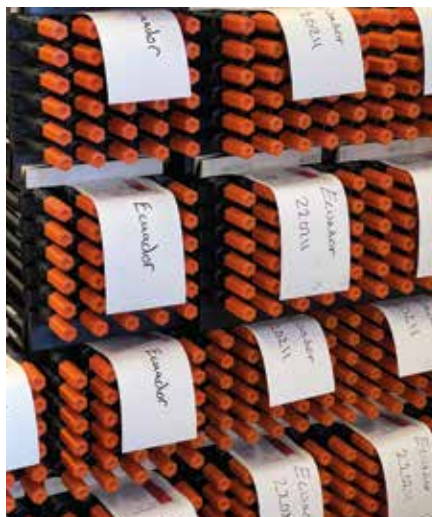
Packat och klart för leverans till sydamerika.