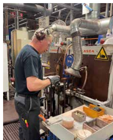
Lödning av hårdmetallskär.